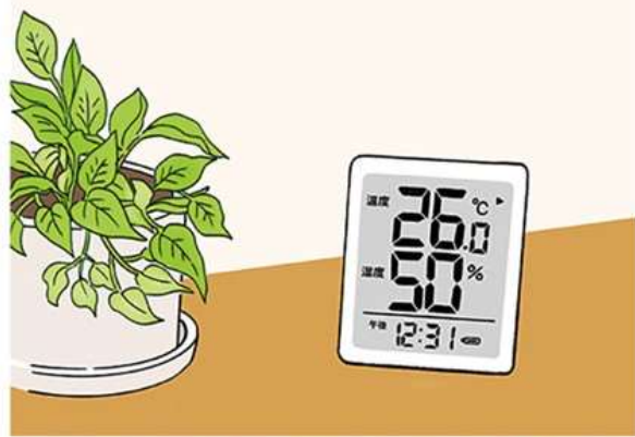
一般的に、過ごしやすい室温は、25～28度、湿度は45～60%とされているので、目安にすると良いですね。

風を通すときは、窓を2ヶ所以上開けると効果的。窓が1つしかない場合は、換気扇や扇風機を使いましょう。