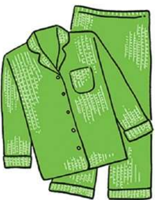
ちぢみやサッカー生地など、ポコポコと凹凸のある素材は、肌との接着面が少なくなるため、さらっとした着心地に。

パジャマも大切です。おすすめ素材は、綿や麻、シルク。特に麻は、汗をかいても肌に張りつきにくく、吸水性が高い素材。放湿性にも優れているため、夏にはぴったりです。素材以外に、デザインもポイントで、Tシャツタイプより、前開きタイプが通気性が良くおすすめです。パジャマの袖口、裾口がゆったりしているタイプも、通気性が良く熱がこもりにくい特徴があります。ご自分に合ったタイプを選んでみましょう。