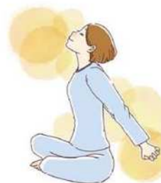
イラスト②ストレッチは一つの動きにつき、10〜15秒程度が目安。無理のない範囲で行いましょう。

て手を後ろに組み、肩甲骨を引き寄せようにして腕を斜め後ろに伸ばしましょう(イラスト②)。 朝には、15〜30分ほど、日光を浴びることをおすすめします。朝日を浴びることで、メラトニンという睡眠ホルモンの分泌が抑制され、体内時計がリセットされます。そして、脳と体を目覚めされてくれるセロトニンという物質が分泌されます。そして、14〜16時間後には再びメラトニンが分泌されると言われているので、起きる時間と寝る時間のリズムが整います。