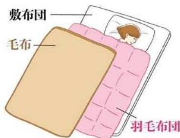
羽毛布団と毛布を使うときは、毛布を上にした方が羽毛布団の保温機能を十分に活かれます。

て手を後ろに組み、肩甲骨を引き寄せようにして腕を斜め後ろに伸ばしましょう(イラスト②)。 朝には、15〜30分ほど、日光を浴びることをおすすめします。朝日を浴びることで、メラトニンという睡眠ホルモンの分泌が抑制され、体内時計がリセットされます。そして、脳と体を目覚めされてくれるセロトニンという物質が分泌されます。そして、14〜16時間後には再びメラトニンが分泌されると言われているので、起きる時間と寝る時間のリズムが整います。