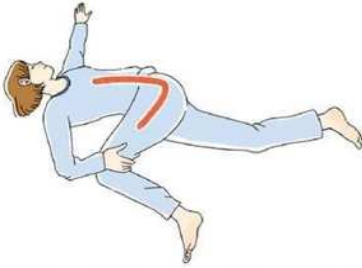
イラスト①ストレッチ中は息を止めず、自然な呼吸を心掛けましょう。

向きます(イラスト①)。そうすることで、お尻から腰、背中、上半身の側面、肩が伸びます。